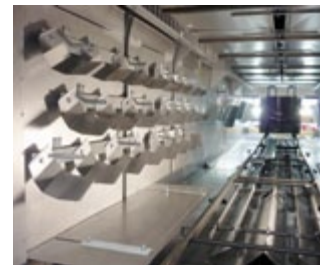
AirFlow Pro mit speziellen Leitblechen seitlich und am Boden, standardmäßig mit doppelwandiger Clean-Ausführung – für höchste Qualitätsansprüche