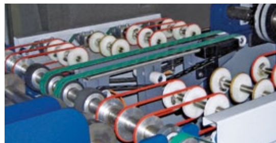
Riemen mit geringerer Auflagefläche