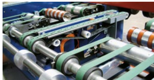
Bänder mit großer Auflagefläche für große, schwere Tafeln