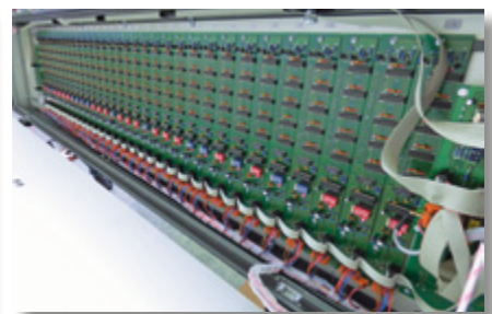
Ansteuerung der Farbzone motoren

Entsprechend der technischen Ausstattung Ihrer Anlage beraten wir Sie ausführlich und stellen Ihnen gerne ein individuelles Angebot zusammen. Sprechen Sie unseren Mr. LineOptimiser an!