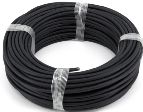
TEMPERATURE COMPENSATING CABLE, J