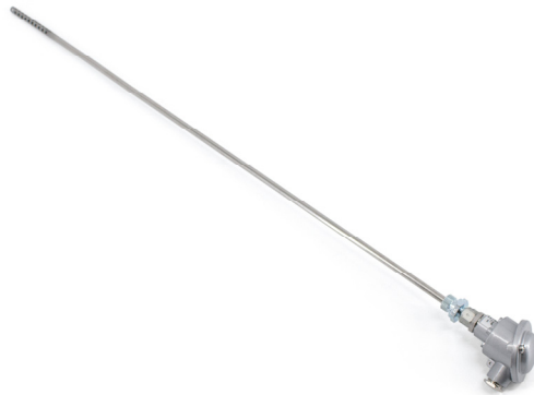
THERMOCOUPLE, J 900mm